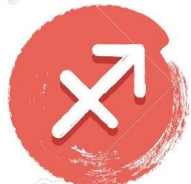
Sagittario 23/11 - 21/12