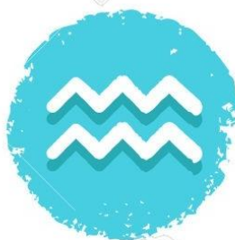
Acuario 21/01 - 19/02