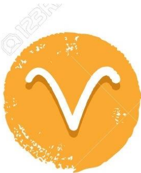
Aries 21/03 - 20/04

Singular ▶ Soy Pluriel ▶ Somos eres sois es son