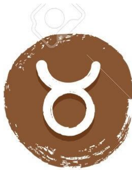
Tauro 21/04 - 21/05