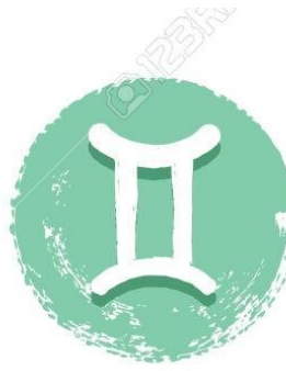
Geminis 22/05 - 21/06