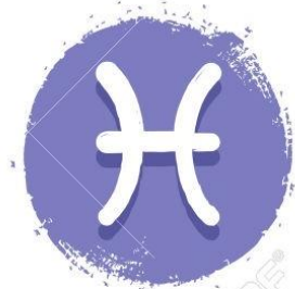
Piscis 20/02 - 20/03