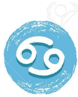
Cáncer 22/06 - 22/07