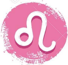
Leo 23/07 - 23/08