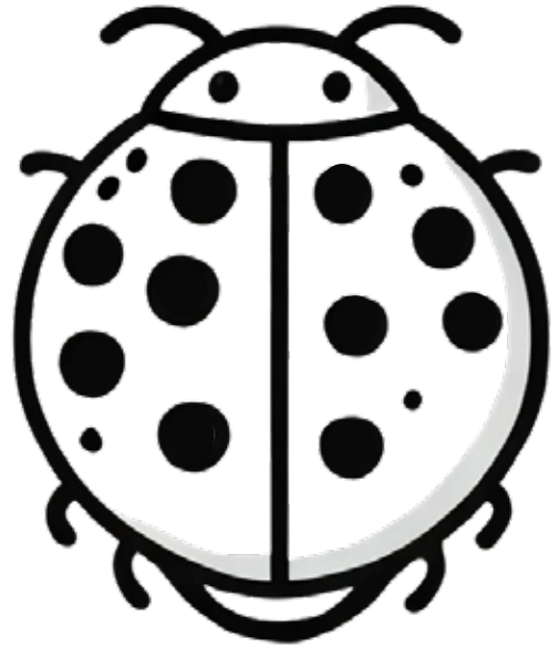
UNE COCCINELLE une coccinelle