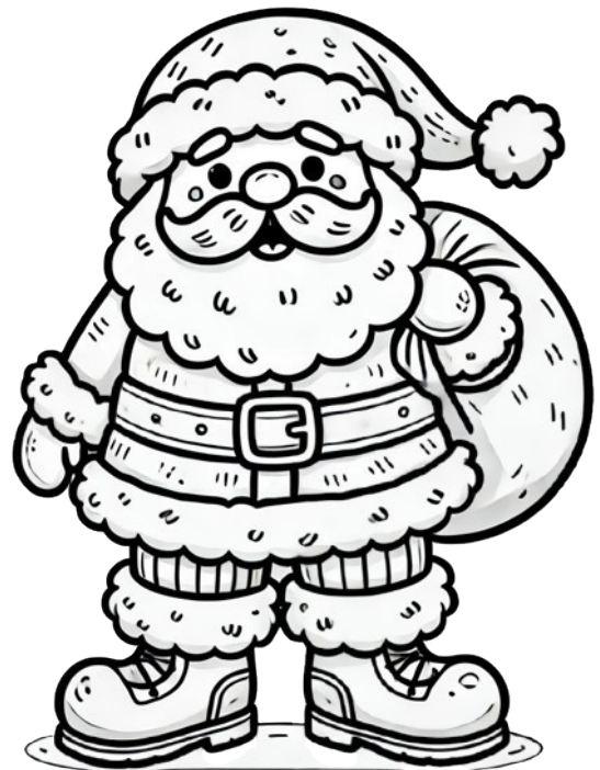
UN PERE-NOEL un Père-Noël