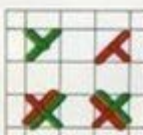
Неполный стежок крестом нитками разных цветов