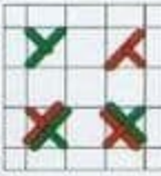
Неполный стежок крестом нитками разных цветов