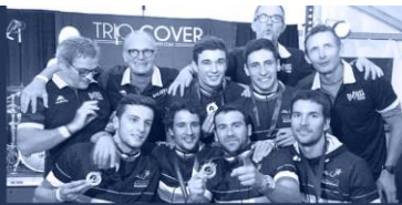
Champion de France 2018