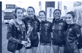
Un club plein d'avenir