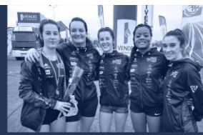
Un club plein d'avenir