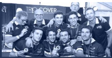
Champion de France 2018