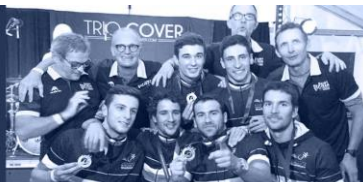
Champion de France 2018