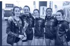
Un club plein d'avenir