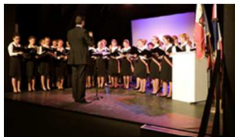
Maitrise de la Maison de la Légion d'honneur de Saint-Germain-en-Laye

Le 8 décembre 2016, au château de Plaisir, l'Office national des anciens combattants et victimes de guerre a été accueilli par Madame le maire pour commémorer 100 ans d'existence au profit de ceux qui furent blessés, dans leur chair ou dans leur cœur, par les guerres que nous avons connues, de ceux qui aujourd'hui se battent pour notre liberté, de ces français victimes des attaques terroristes.