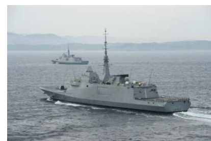
Frégate Multi-mission Auvergne

C'est le 15 septembre 2016 que le premier commandant de la FREMM Auvergne a été reconnu par l'amiral commandant la force d'action navale (ALFAN). A cette occasion, la cérémonie de la première levée des couleurs, a constitué un évènement majeur pour le bâtiment, prenant ainsi le titre de navire de guerre. Quatrième exemplaire d'une série de huit, la FREMM Auvergne sera livrée à la marine nationale au printemps 2017 avant d'être admise au service actif au terme d'un déploiement longue durée qui permettra de valider ses capacités militaires. Le triptyque « frégate multi-missions, hélicoptère de combat marine Caïman, missile de croisière naval » représente un bond capacitaire et constituera à terme une bascule stratégique.