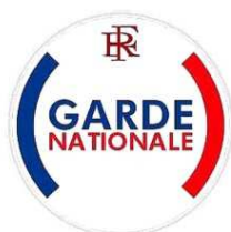
Badge de manche

Décret n° 2016-1364 du 13 octobre 2016 entré en vigueur le 14 octobre 2016 (extrait du Bulletin officiel)