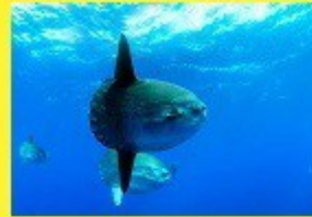
le poisson lune