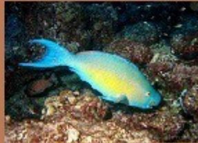
le poisson perroquet