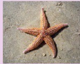
l'étoile de mer