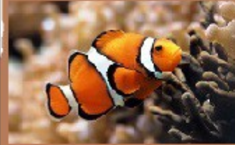
le poisson clown