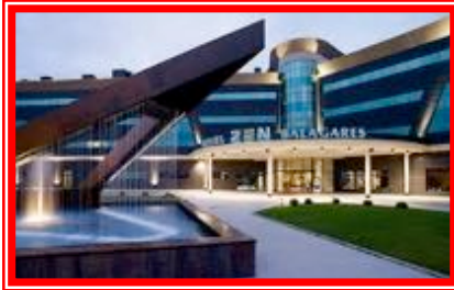
HOTEL & SPA & GOLF ZENBALAGARES **** SUP.