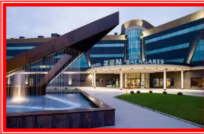
HOTEL & SPA & GOLF ZENBALAGARES **** SUP.