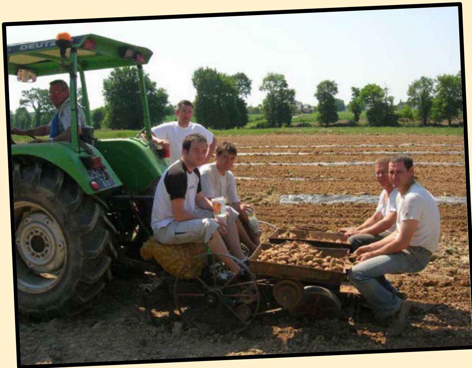
Première expérience à La Chapelle Thouarault....