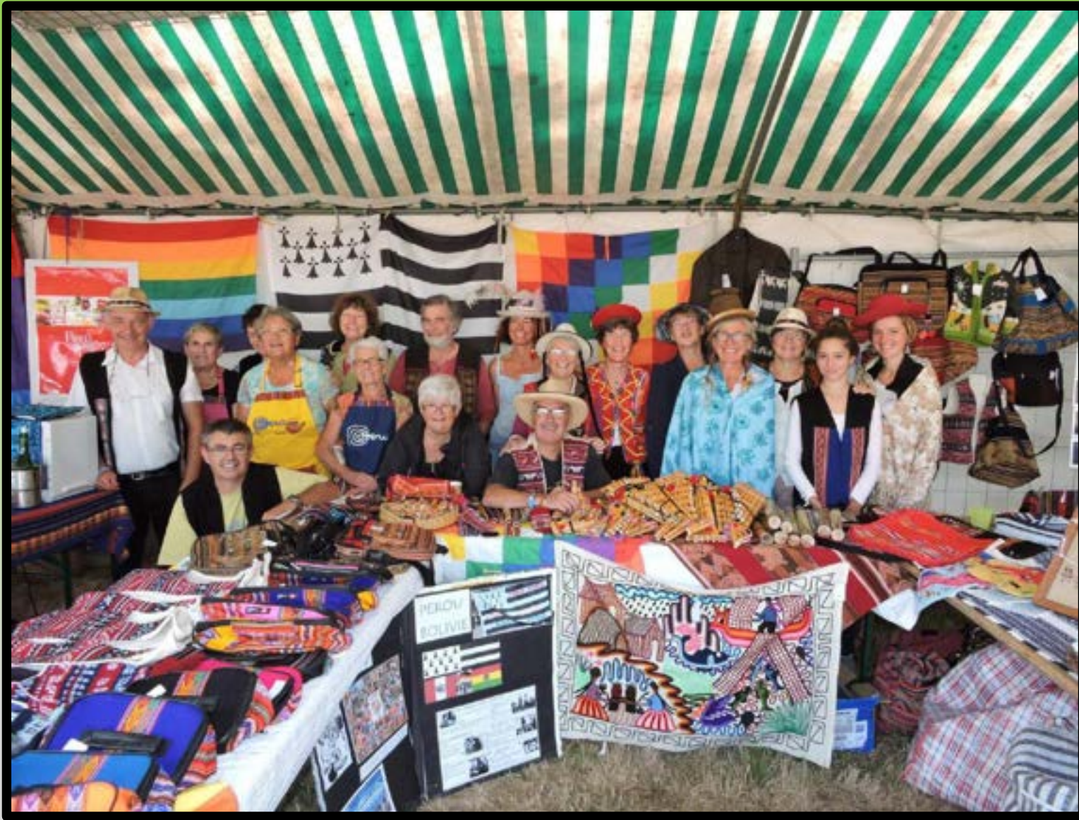
La belle équipe à la fête de la galette!