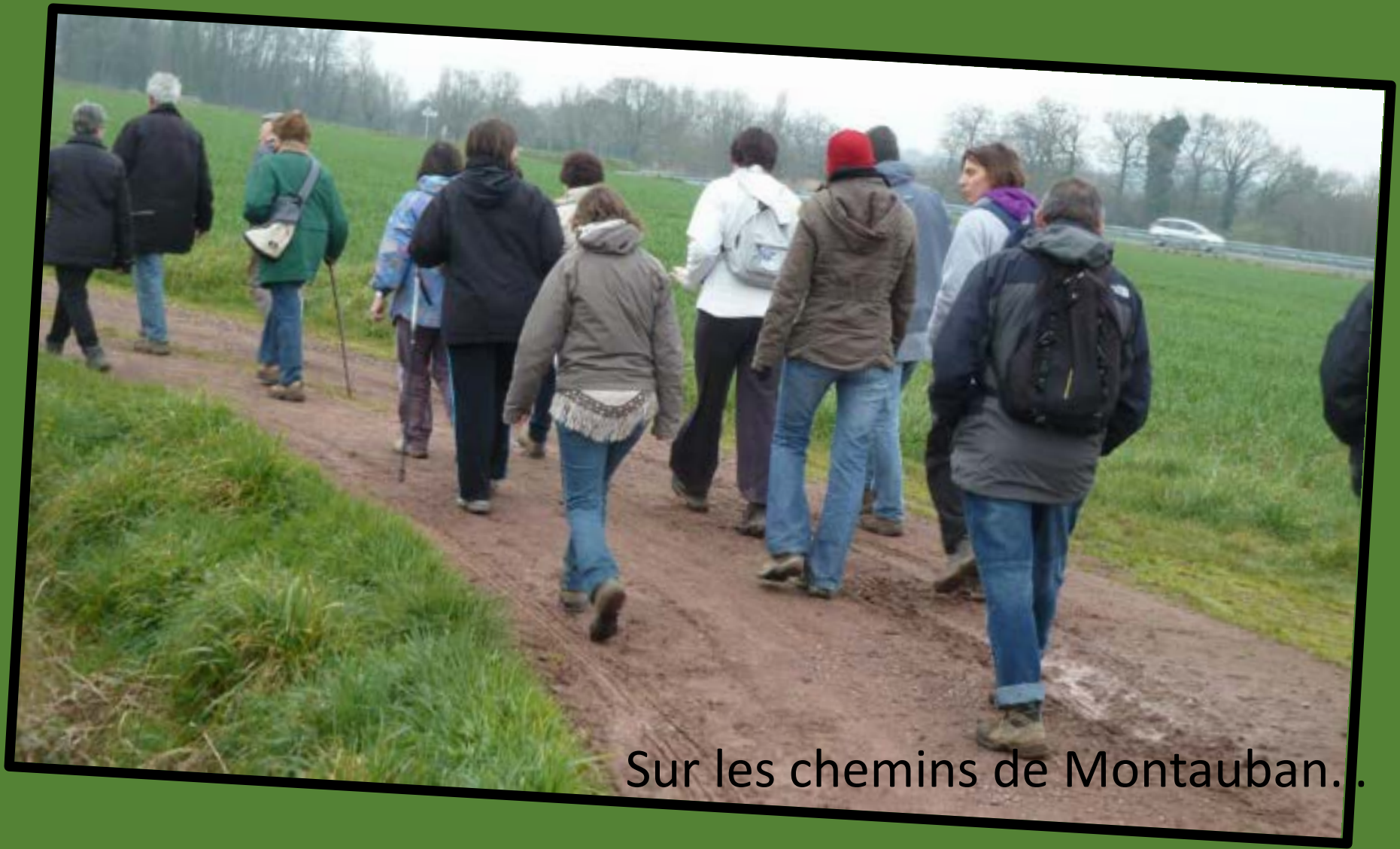
Sur les chemins de Montauban..