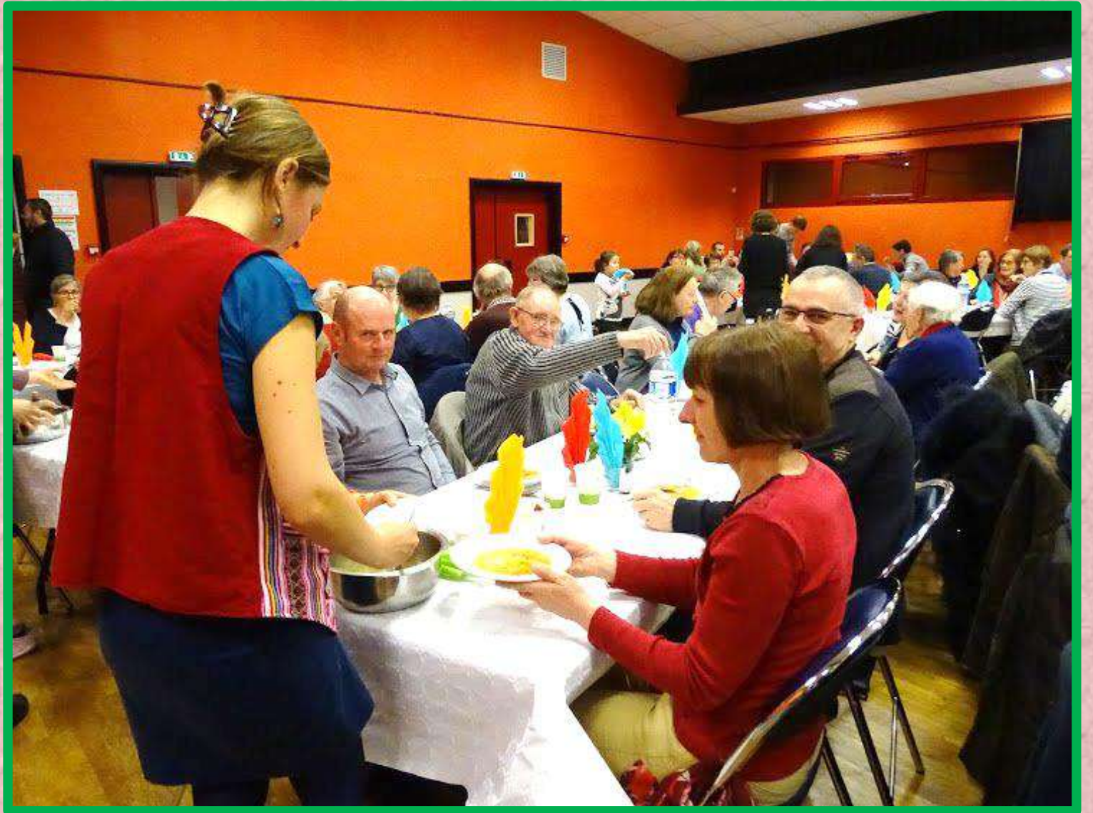
Une jeune équipe au service...