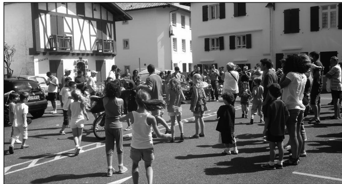
Entzierro ttipi, herriko pesten kari, ikastolak antolatutarik Entzierro ttipi, pendant les fêtes, organisée par l'Ikastola

Quelques jours avant la fête, les forains appellent; il