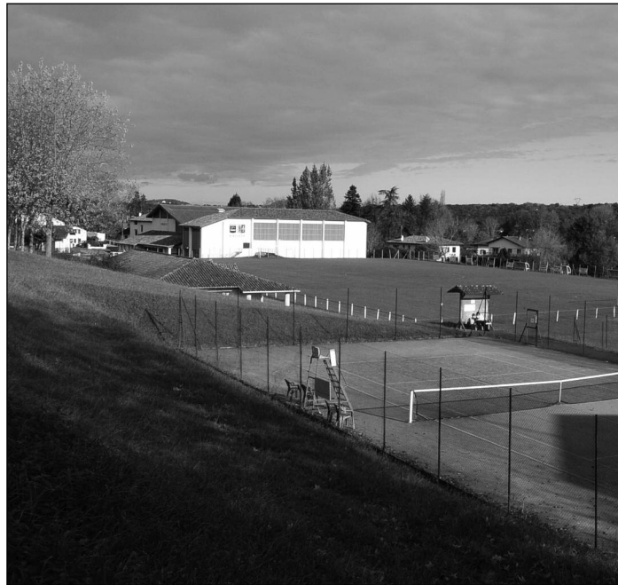
Kiroleta, errepede nagusitik ikusirik Kiroleta, vue du bord de route

La gendarmerie actuelle va disparaître et la brigade s'installerait, suite à des tractations avec l'évêché, dans un bâtiment qui serait édifié au bas de la colline du collège