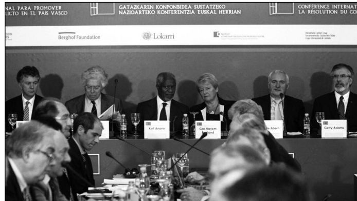
Kofi Annan, Bertie Ahern, Pierre Joxe, Gerry Adams, Gro Harlem et Johnathan Powell besteak beste Donostiako Bake Konferentzian

Après 40 ans de lutte, l'ETA a décidé d'en finir avec la lutte armée. Pour cela, le mouvement indépendantiste basque a décidé de privilégier l'action démocratique et pacifique. Et ce, à l'initiative de l'ETA et avec le soutien d'organisations internationales et personnalités spécialisées dans la médiation qui ont eu pour tâche de favoriser le dialogue pour résoudre les conflits. Auparavant, plusieurs tentatives de négociations avaient déjà eu lieu, mais aucune d'entre elles n'avait pu aboutir.