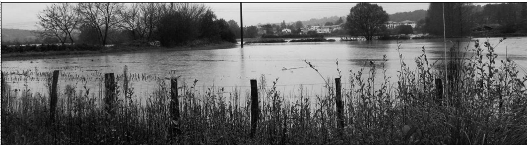
Etxepareako eremua, 2011ko azaroko uholdeetan La zone Etxeparea, lors des dernières inondations de novembre 2011

Gai minberatsua. Zango baloi zelai berri bat eraikitzeko, auzapeza eta bere taldeak 17 ha lur trukatu dituzte. Herriko Etxeak laborantxako 17 ha lur emaiten ditu, denak toki onean, etxegintzako lur eremuen auzoan. Heien truk 17 ha ukan ditu Etxeparea inguruan, Errobiren ondoan, gehienak urak hartzen dituenak. HBD-ek betidanik dio zango baloi zelai berri bat beharrezkoa dela, baina molde hortan, behargabeko 17 ha lur trukatzea herriaren ontasunak behargabean eta nolana hizka xahutzea dela.