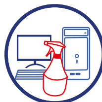
Désinfecter les surfaces de travail