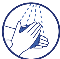
Se laver très régulièrement les mains