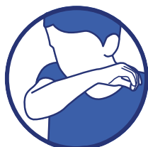
Tousser ou éternuer dans son coude ou dans un mouchoir