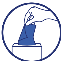
Utiliser un mouchoir à usage unique et le jeter