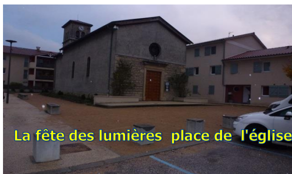
La fête des lumières place de l'église

Venez nombreux, tous les bénéfices seront versés au TELETHON