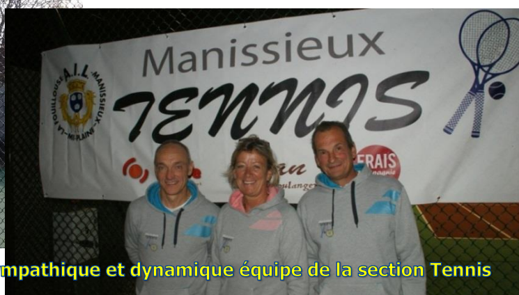
La sympathique et dynamique équipe de la section Tennis

La section TENNIS souhaite la bienvenue à ses nouveaux adhérents.