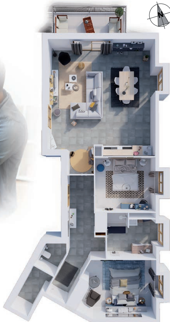
Exemple d'aménagement en vue aérienne d'un appartement T3

Loi Pinel : réduction d'impôt pour l'acquisition à compter du 1 er septembre 2014 d'un logement neuf situé dans certaines zones géographiques destiné à la location pendant 6, 9 ou 12 ans à un loyer plafonné, et à des locataires sous plafonds de ressources. Cette réduction d'impôt est prise en compte pour le calcul du plafonnement global de certains avantages fiscaux visés à l'article 200-0 A du CGI. Le non-respect des engagements de location entraîne la perte du bénéfice des incitations fiscales.