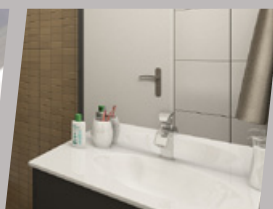
Meuble vasque dans les salles d'eau