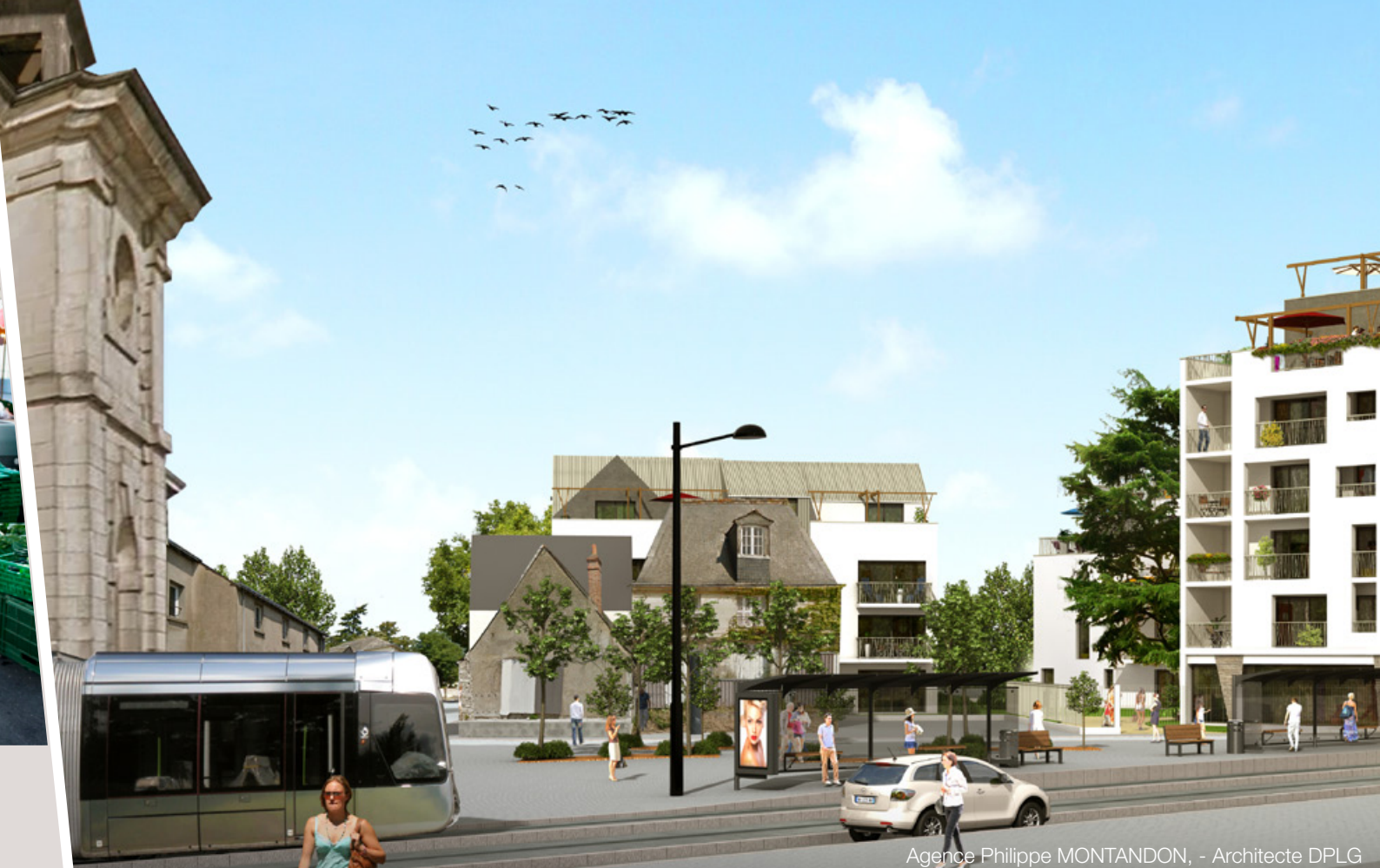
Agence Philippe MONTANDON, - Architecte DPLG

Avec l'arrivée du Tramway, le quartier Christ-Roi s'est transformé à l'ère du XXI e siècle : l'accessibilité au centre-ville de Tours est plus rapide ; l'avenue Maginot s'est embellie laissant plus de place aux déplacements doux, avec notamment l'élargissement des trottoirs valorisant ainsi ses commerces, et la plantation d'arbres d'ornement. Le nouveau dessin de cette avenue et la création de la Place Pilorget, renforcent ainsi l'image d'un quartier moderne et à taille humaine.