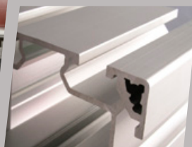
Baies coulissantes sur les séjours