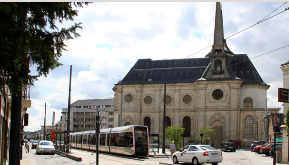
Place du Pilorget - Eglise Christ-Roi