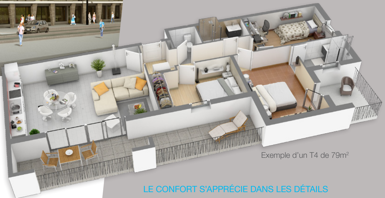
Exemple d'un T4 de 79m 2