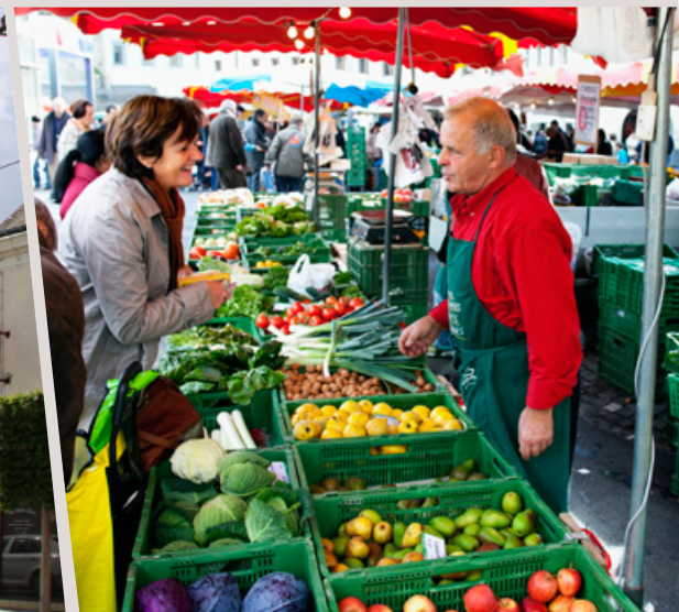
Marché Place du Président Coty