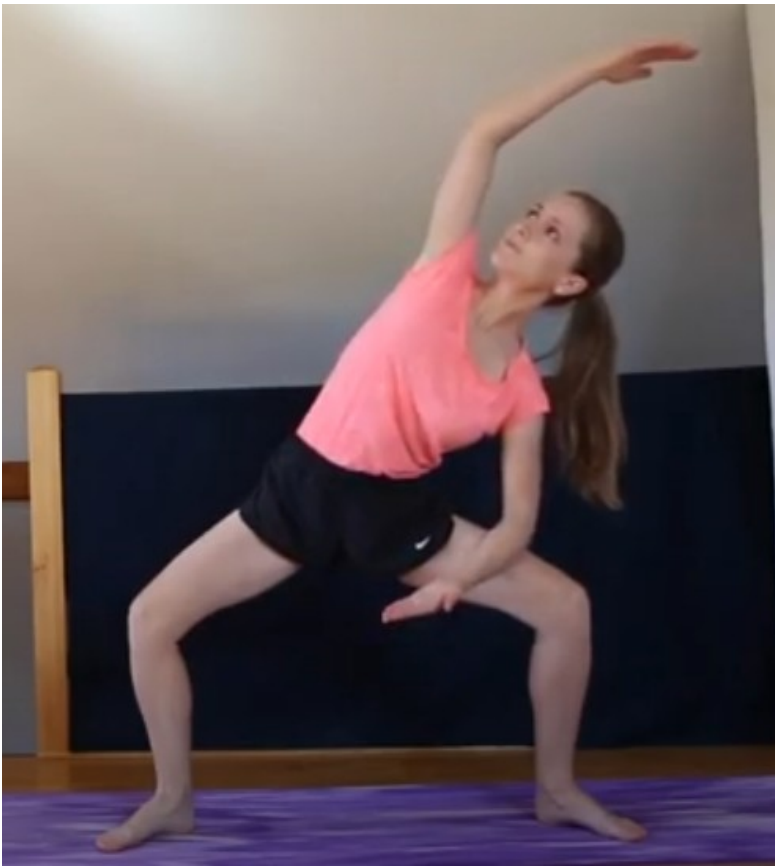
Romain le singe