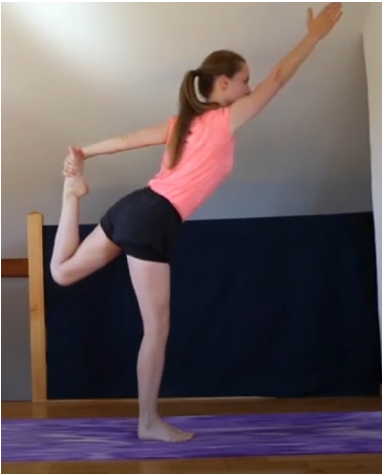
Eric le moustique