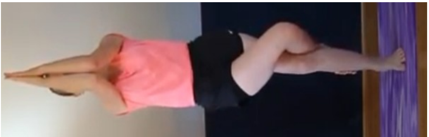
Le flamand rose