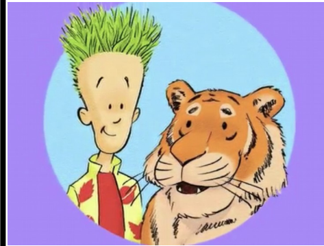
Brind'nature et Tim