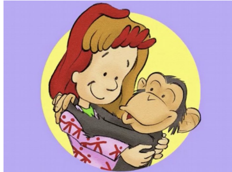
Boute-en-train et Zig