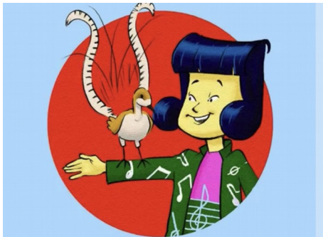
Clé-de-sol et Dièry