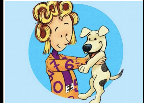
Calculine et Gram