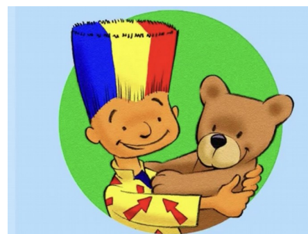
Imagio et Flon