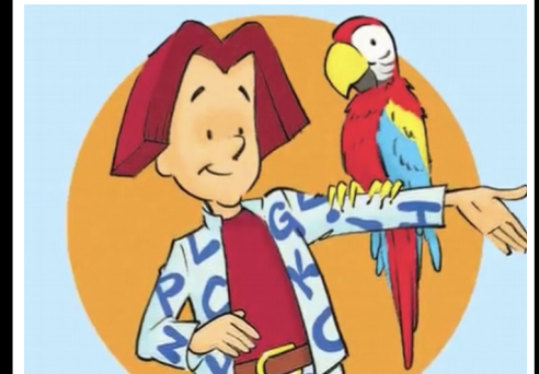
Mot-à-mot et Bek