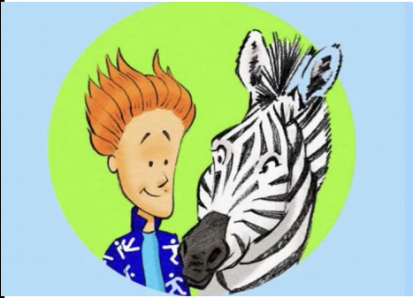
Agilo et Tag