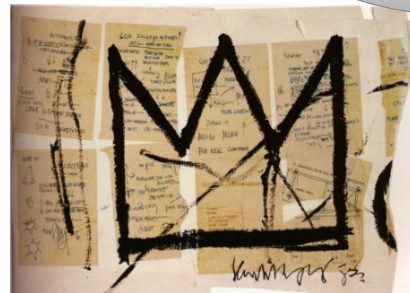
Jean-Michel Basquiat Couronne, 1983