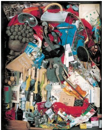
Arman Auto-portrait robot