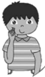
Une personne sourde et muette

Ici et ailleurs, nos corps sont différents