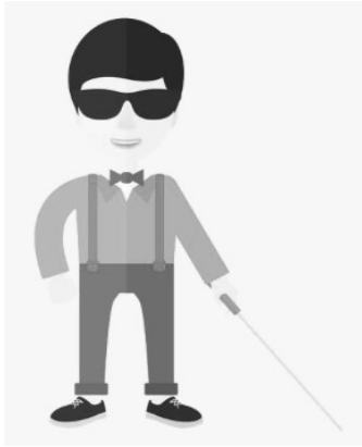
Une personne aveugle

Ici et ailleurs, nos corps sont différents