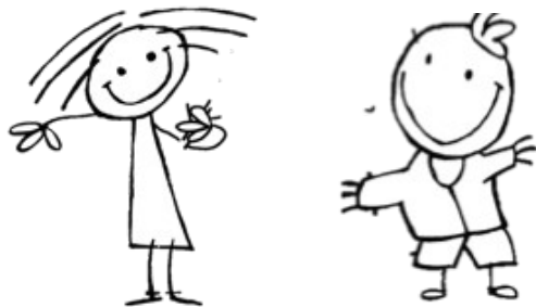
Une fille et un garçon

Ici et ailleurs, nos corps sont différents