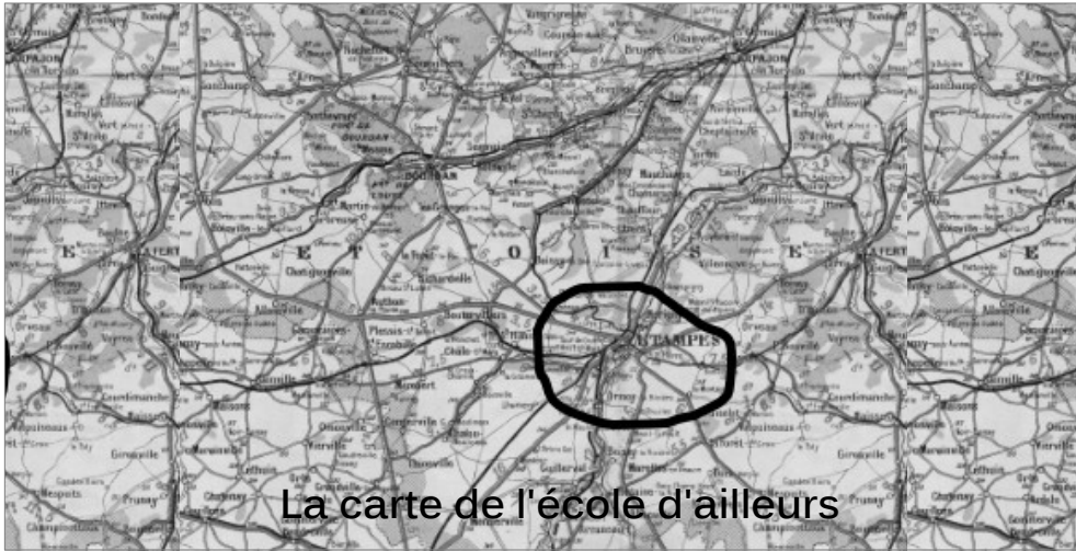
La carte de l'école d'ailleurs