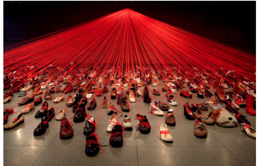
Over the continents, Chiharu Shiota

Et j'apprends à réaliser des compositions plastiques, en petit groupe, en réinvestissant des techniques et des procédés : faire des noeuds.