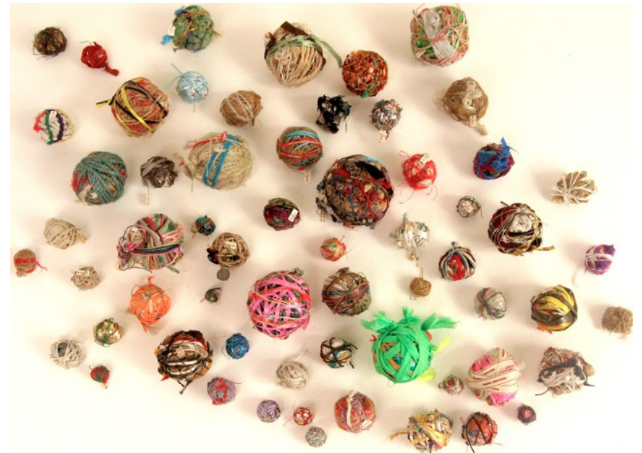
Le journal d'Ariane 1985

Dans mon carnet de voyage , j'ai choisi et collé des photos souvenirs de notre défi