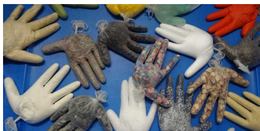
Proposition de Mimi

Consigne: « Voici le bac à gants, attention ,ne pas chercher à percer un gant car ensuite on ne pourrait plus l'utiliser »