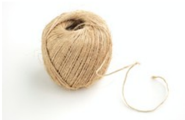
De la ficelle