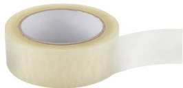
Du ruban adhésif