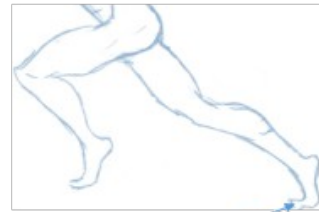
LES DOIGTS DE PIED