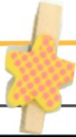
Photo souvenir de la rencontre « C'est pas du jeu »