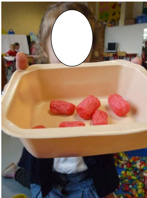
Une soupe de tomates.