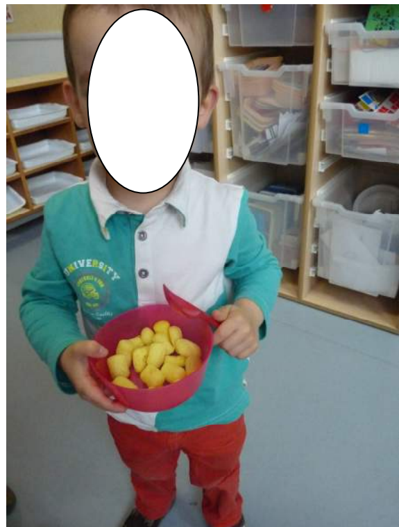
Du jus de citron.