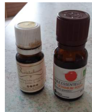
quelques gouttes d'huile essentielle