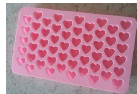
un moule en silicone