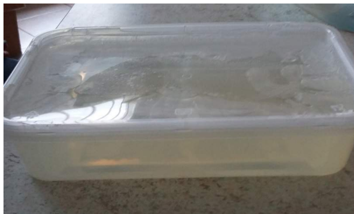
Un bloc de glycérine