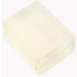
un bloc de glycérine pure