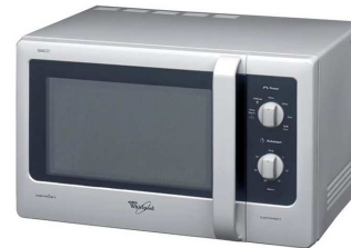
un four micro – onde