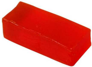
de la pâte à colorer