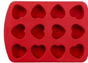
un moule en silicone avec des petites formes (par exemple, des cœurs)