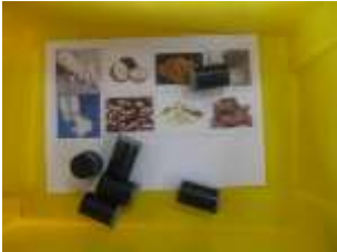
Reconnaitre 8 goûts différents