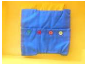
Fermer un vêtement avec des boutons