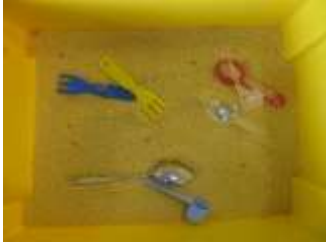
Tracer des routes avec les fourchettes et les billes