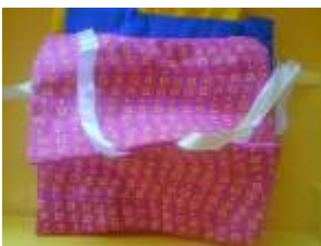
Fermer un vêtement avec des rubans