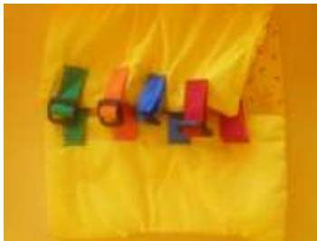
Fermer un vêtement avec des sangles