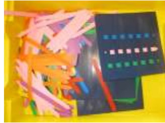
Réaliser un tissage croisé