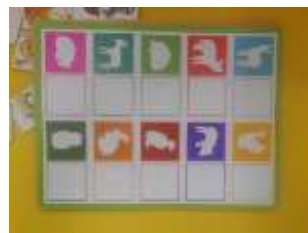
Retrouver les silhouettes des animaux de la savane et de la forêt