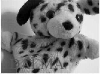
la marionnette Dalma