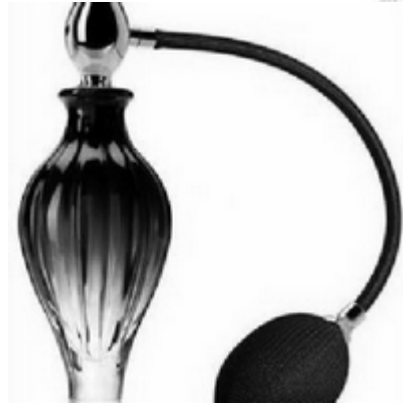
le parfum de la maitresse