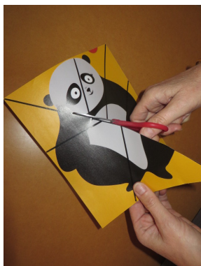
Photo pour devant tiroir

Je colle les morceaux du puzzle sur la feuille.