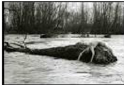
Un tronc d'arbre et des rames