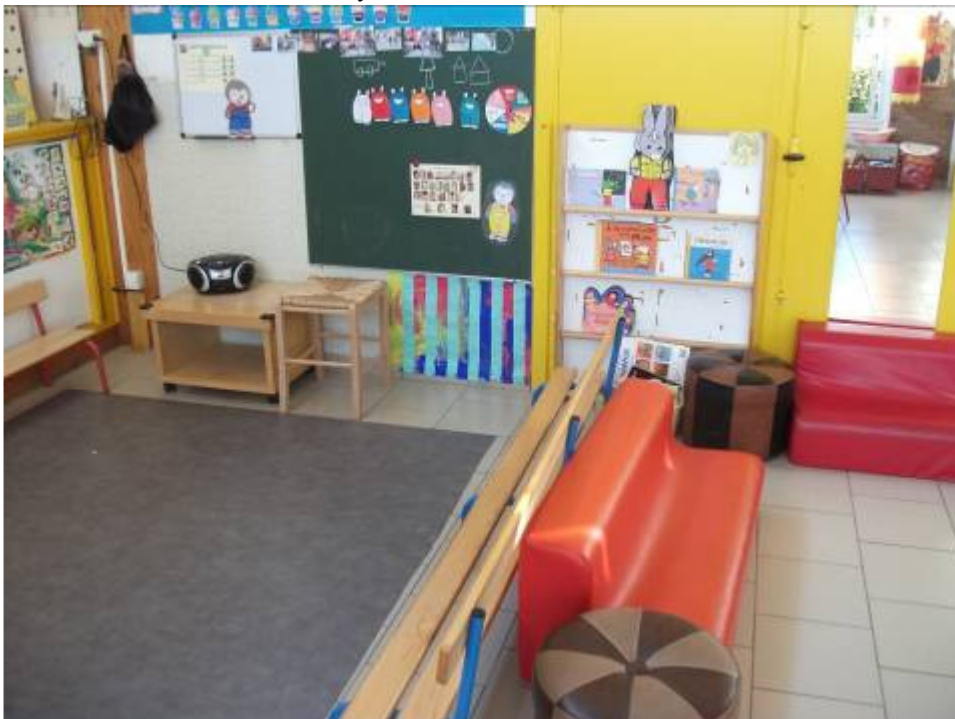
Le coin regroupement