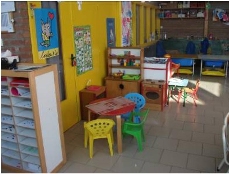
Le coin cuisine