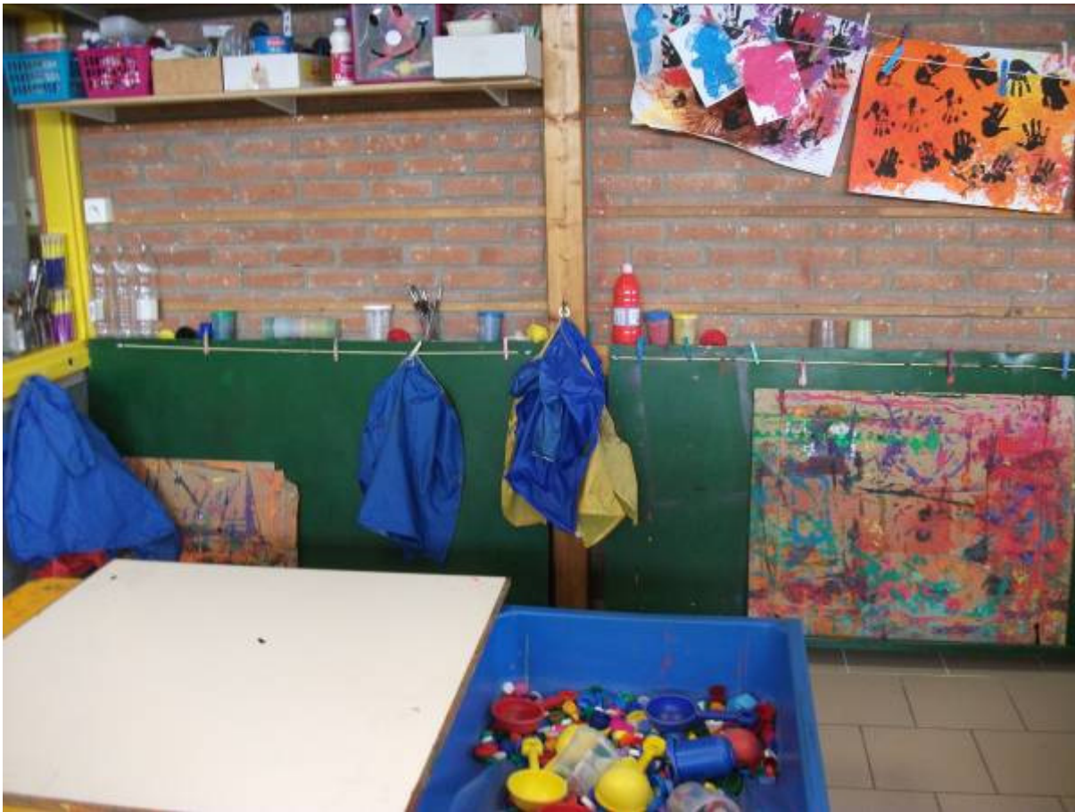
Le coin peinture et transvasements où se trouve aussi maintenant ma « machine à bouchons ».