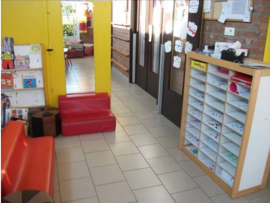
L'entrée (porte marron à droite : le dortoir)

Je vous la présente en tournant dans le sens inverse des aiguilles d'une montre. Elle est ensoleillée et spacieuse.