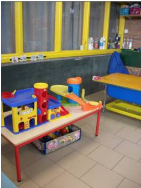
Le coin garage