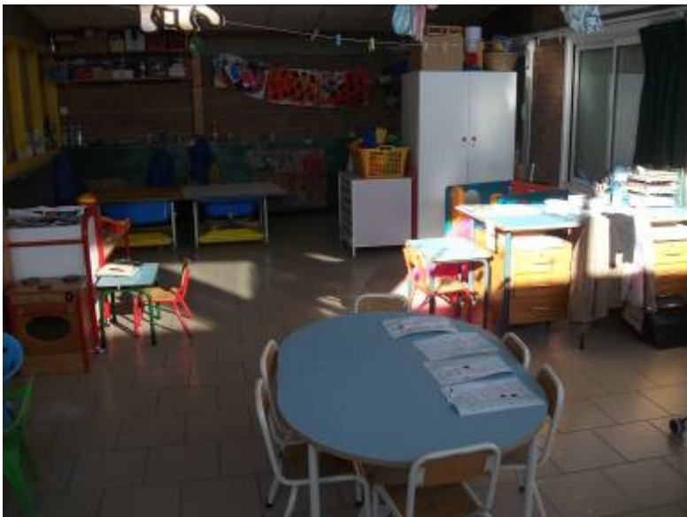
Vue plus large

C'est ma quatrième année dans ce niveau et cette classe et je pense avoir enfin trouvé un aménagement qui me convient ! D'ailleurs, quand des « anciens » (des MS) entrent dans la classe, plusieurs d'entre eux disent « elle est belle ta classe maîtresse ! ». (Bon, depuis il y a encore plus d'affichage et de couleurs !)