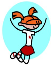
faire de l'EPS