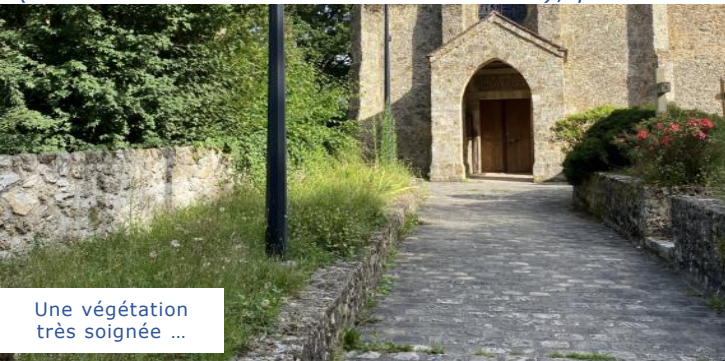
Une végétation très soignée ...

La mairie devrait demander l'intervention de l'architecte de conception et d'exécution, le Cabinet J. Liochon, promoteur de cette très onéreuse réalisation avec l'entreprise Colas (Leader mondial des travaux routiers), pour une démonstration de l'entretien de leur réalisation ?