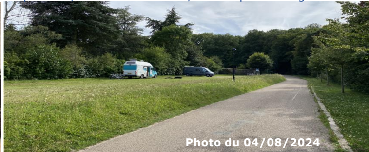
Photo du 04/08/2024

Ne serait-il pas possible d'entretenir et d'élaguer les arbres et les haies, pour préserver un paysage ouvert sur l'Eglise, classée Monument Historique ?