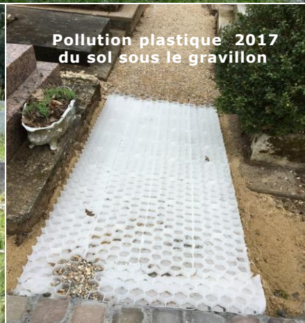
Pollution plastique 2017 du sol sous le gravillon

Note 39 du 20/08/2024 remise à M. le Maire