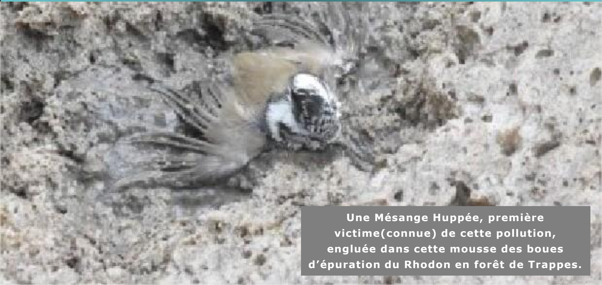
Une Mésange Huppée, première victime(connue) de cette pollution, engluée dans cette mousse des boues d'épuration du Rhodon en forêt de Trappes.

Ordre de grandeur des honoraires partagés suivant la convention de répartition des 7 participants, pour le mémoire au fond 1 500 €HT et avec les réponses de 8 à 9 000 €HT