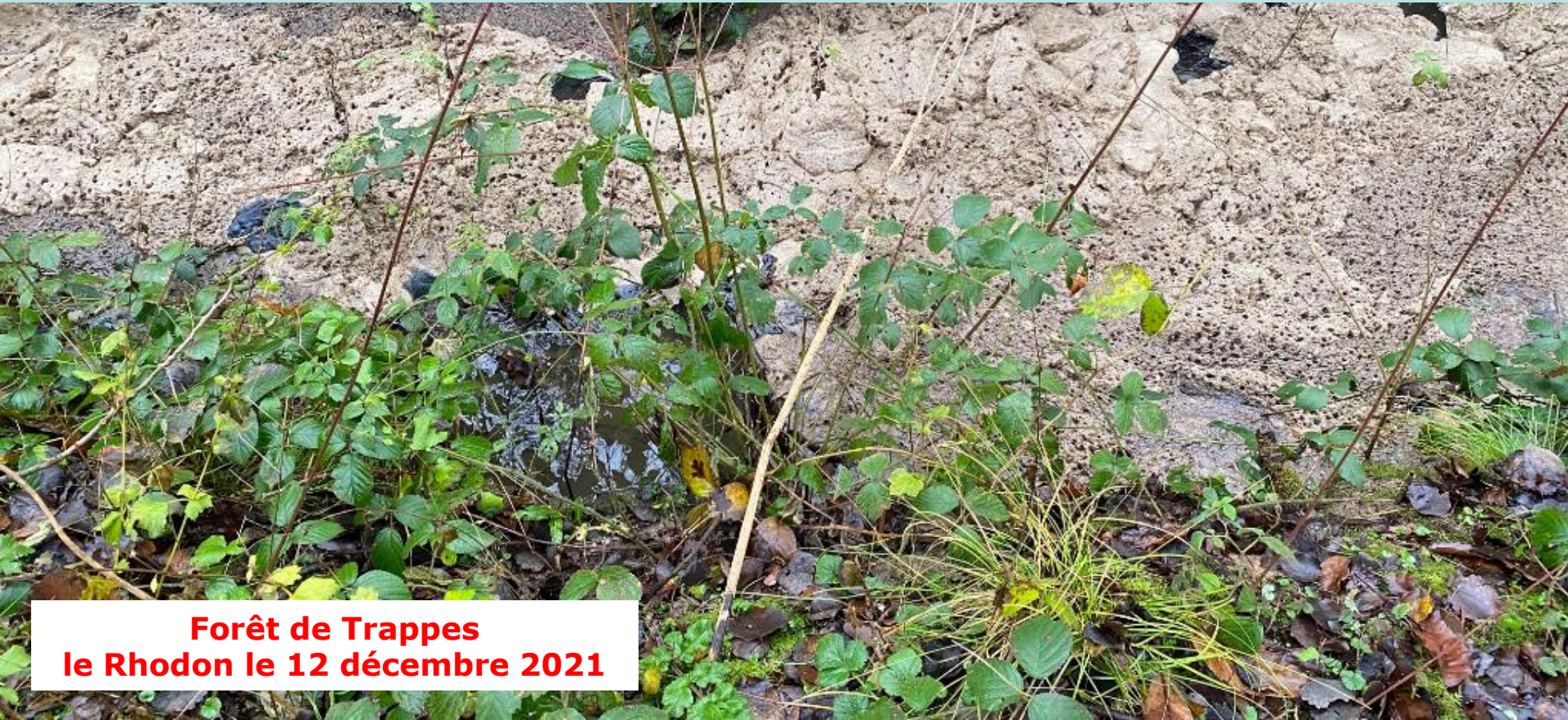
Forêt de Trappes le Rhodon le 12 décembre 2021

Il s'agit d'obtenir du SIAHVY et des autres responsables de la situation identifiés comme tels par l'Expert, qu'ils assument les préjudices que nous avons subis du fait de la pollution du Rhodon.