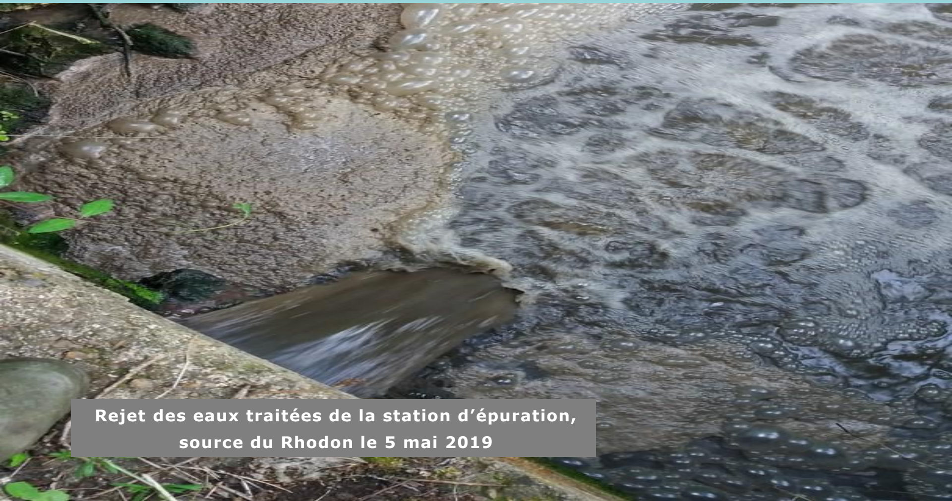
Rejet des eaux traitées de la station d'épuration, source du Rhodon le 5 mai 2019

Proposition intéressante du Parc au SIAHVY: rejeter les eaux épurées dans le milieu avec des bassins épurateurs et non plus dans le Rhodon. Info de mars 2023 de C. Giobellina, Présidente de l'Union, suite à sa présence à la réunion du SAGE Orge Yvette.