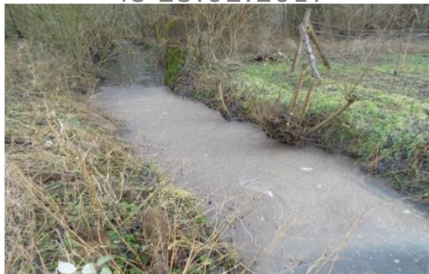
Rejet STEP dans le Rhodon le 08.12.2017

Le Rhodon prairie la Poufille le 23.02.2017