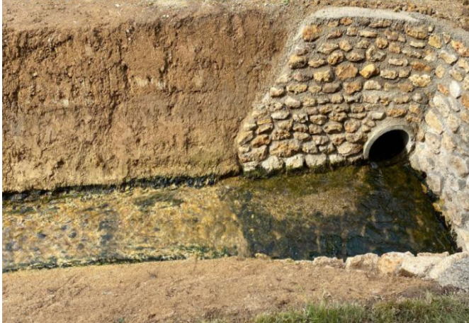
Buse de rejet des eaux épurées de la STEP du Mesnil-St-Denis dans le fossé crée en août et raccordé au Rhodon - Photo du 23.11.2021