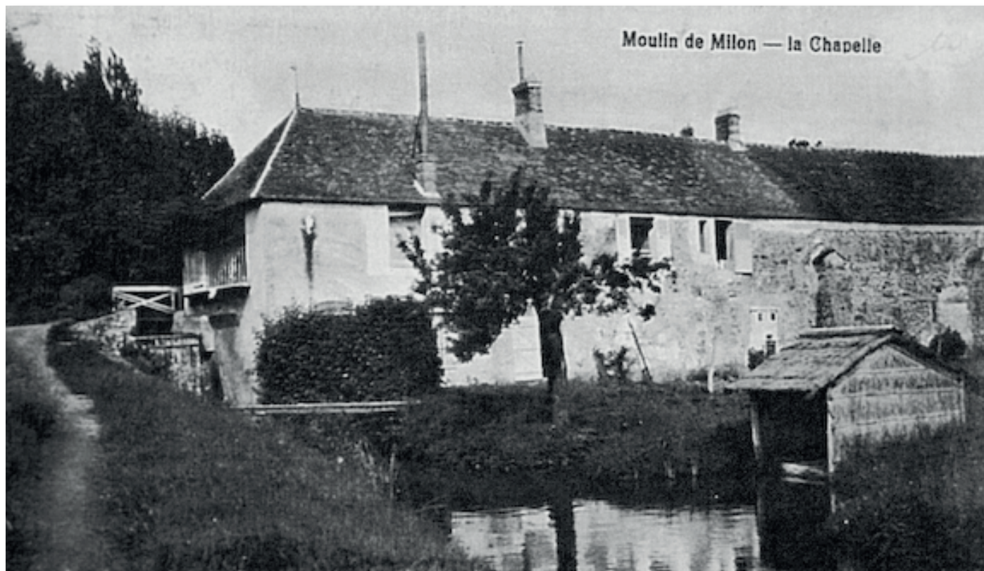
Le Moulin de Milon