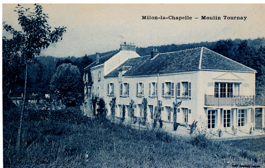
Milon-la-Chapelle – Moulin Tournay