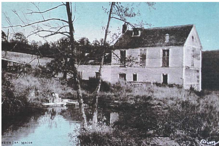
Le Moulin de Fauvaux

Cette énergie a permis la construction de 6 moulins à eau.