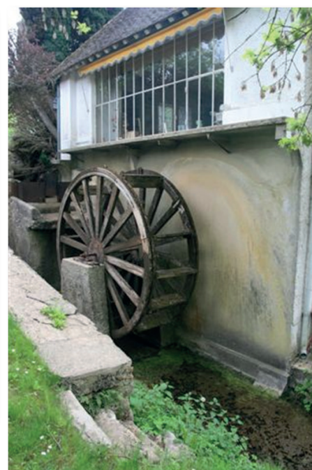
Ci-contre : la roue à aubes encore en état de fonctionnement du Moulin de Milon