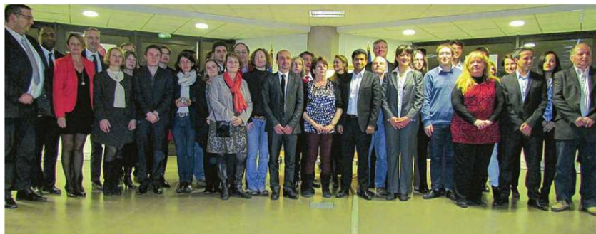
Tous les candidats désignés étaient rassemblés au siège de l'agglomération de Saint-Quentin-en-Yvelines.

La fédération socialiste des Yvelines a dévoilé vendredi soir ses candidats aux élections départementales.