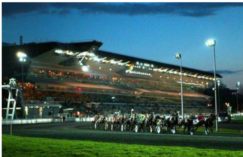
LE JOURNAL GRATUIT DU PARIEUR - 17 DECEMBRE 2023 - COUPLE DU JOUR DU TIERCE EN COUVERTURE