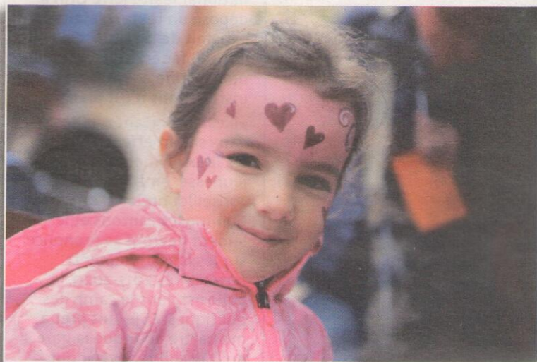
A l'instar de la petite Ninon