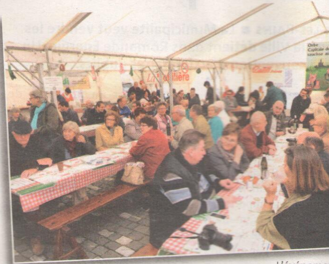
L'événement nouvelle fois placé sous le signe de la c