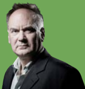
Hervé LE TELLIER