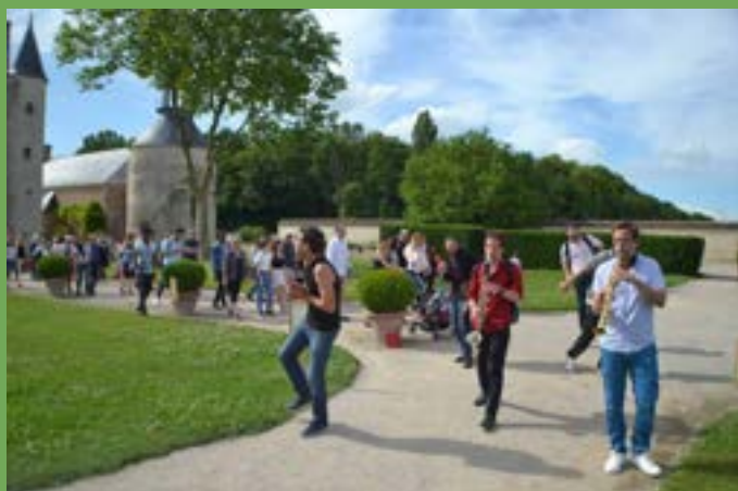
Fête de la Nouvelle