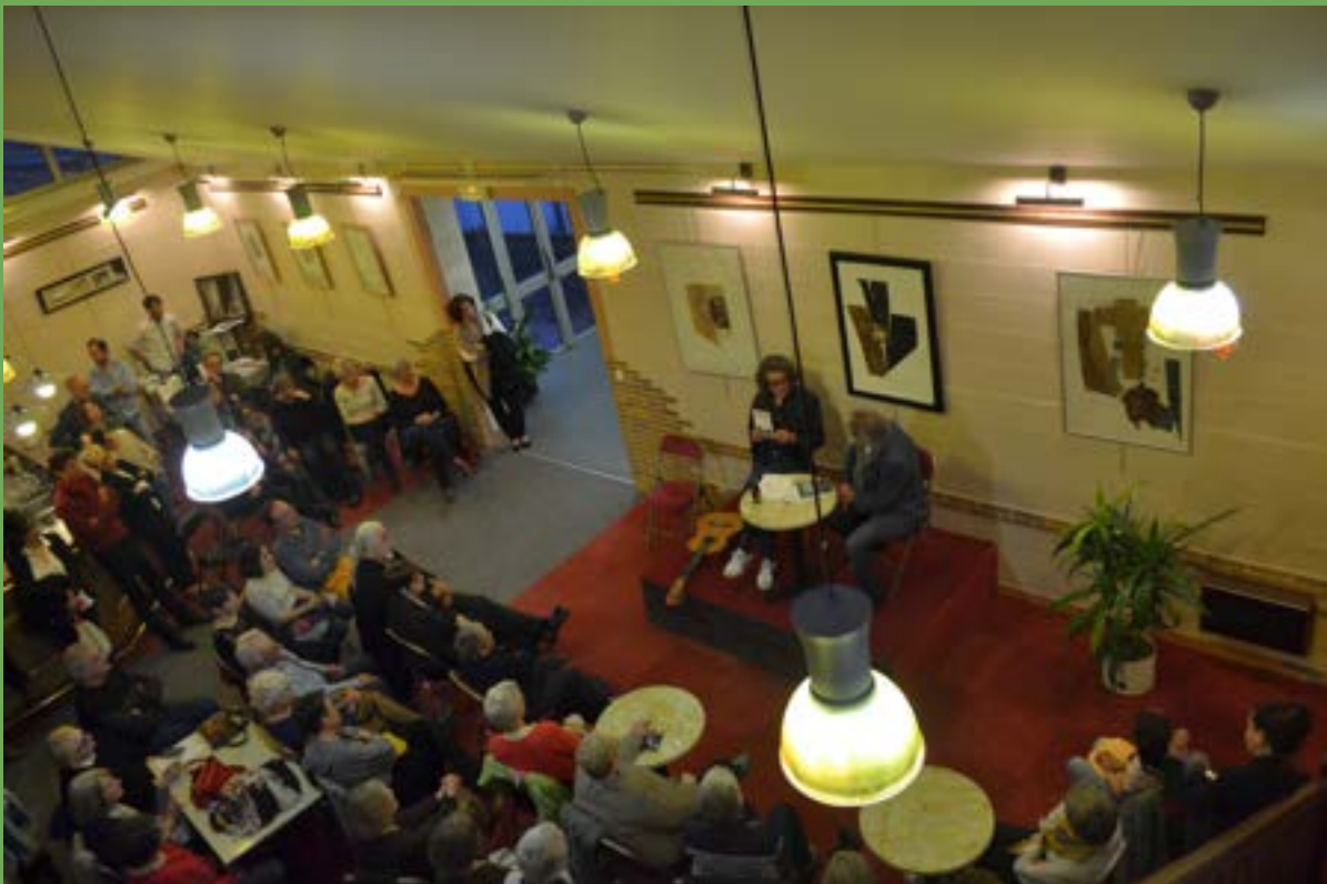
Nuit de la Nouvelle 2019