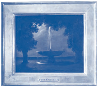
(La vasque de la villa Médicis à Rome - Effet de nuit) Léon Cogniet (1794-1880) Musée des Beaux-Arts d'Orléans