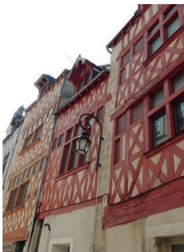
Rue de l'Empereur, façades du 16 ème siècle

Malgré les importantes destructions liées aux travaux d'urbanisme des 19 ème et 20 ème siècles et à l'incendie de 1940, l'étude de l'évolution architecturale de l'habitat domestique à Orléans est facilitée par la conservation d'un riche corpus de maisons élevées à la fin du Moyen Âge et au début de l'époque Moderne. Désormais mieux connue pour son architecture à pan de bois, Orléans, foyer humaniste de la seconde Renaissance, se distingue également par la qualité de sa construction en pierre et/ou en brique. L'objectif est de présenter plusieurs catégories d'édifices, de la maison polyvalente héritée des siècles précédents aux grandes demeures constituant les premiers exemples d'hôtels particuliers de la ville, souvent à l'initiative de riches bourgeois ou de grands personnages.