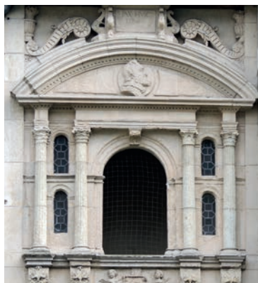
Maison Henri IV

Faites confiance au guide, il vous parlera d'un sujet inédit... seulement voilà... c'est à vous de le découvrir ! Suivez ses pas, en véritable fil conducteur, il vous aidera à percer le mystère de cette visite. Une chose est certaine, nous vous parlerons du 16 ème siècle ! Une récompense sera attribuée au visiteur qui trouvera la bonne réponse !