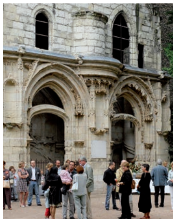
Jardin de l'Hôtel Croisot

Les plus prestigieuses demeures Renaissance d'Orléans n'auront plus de secret pour vous grâce aux explications de nos guides costumés !