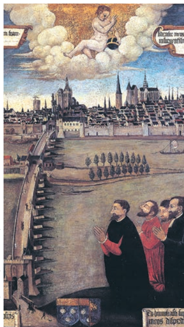
Les Échevins, 16 e siècle, détail © MHAO, Musée d'Orléans.

Tarifs : 6€ (plein tarif), 3€ (tarif réduit), gratuit (1 er dimanche du mois), billet groupé valable une jour- née donnant droit à l'entrée du Musée des Beaux- Arts, de l'Hôtel Cabu, de la Maison Jeanne d'Arc et du Centre Charles Péguy.