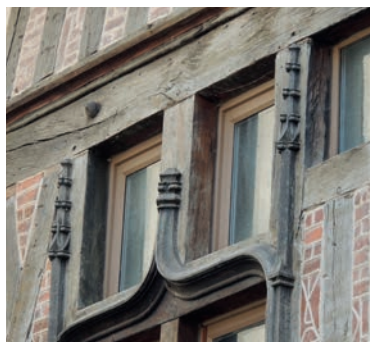
Maison rue du Vaudour

Sous forme de jeu, cette visite vous entrainera à Orléans au 16 ème siècle. Visite ouverte aux enfants de 6 à 12 ans accompagnés d'au moins un adulte.