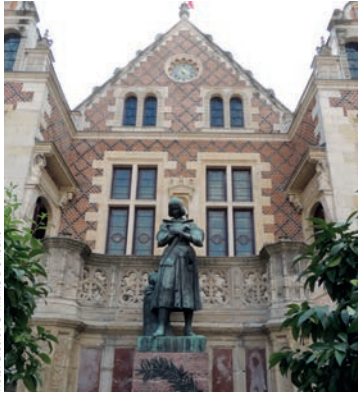
Hôtel Groslot

Monument emblématique d'Orléans, cet hôtel particulier du 16 ème siècle a vu passer dans ses murs de nombreux personnages illustres. Il présente un plan et une architecture Renaissance qui seraient attribués à JACQUES ANDROUET DUCERCEAU. Au 19 ème siècle, le bâtiment devenu Hôtel de ville est agrandi et doté d'un riche décor Néo-Renaissance représentatif de l'engouement de l'époque pour le 16 ème siècle.