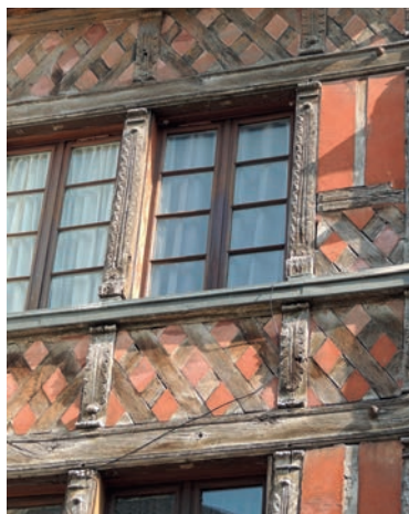
Maison rue Sainte-Catherine

Cette visite vous emmènera à la découverte du 16 ème siècle à Orléans, à la lumière de grands événements. La Renaissance a laissé à la Ville de nombreux témoignages de son architecture de pans de bois ou de pierre. Sur les façades donnant sur les rues ou cachées dans les cours intérieures, fleurissent les décors luxuriants et raffinés de cette époque, largement inspirés de l'Antiquité.