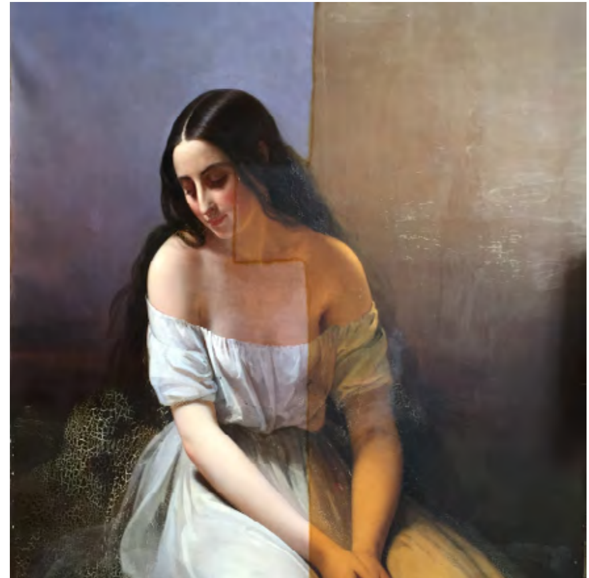
Aimée Brune-Pagès Femme à genoux (en cours de restauration)

Vendredi 20 mai , 18h30, musée des Beaux-Arts d'Orléans