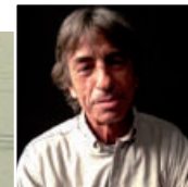
José Vieira © France Inter